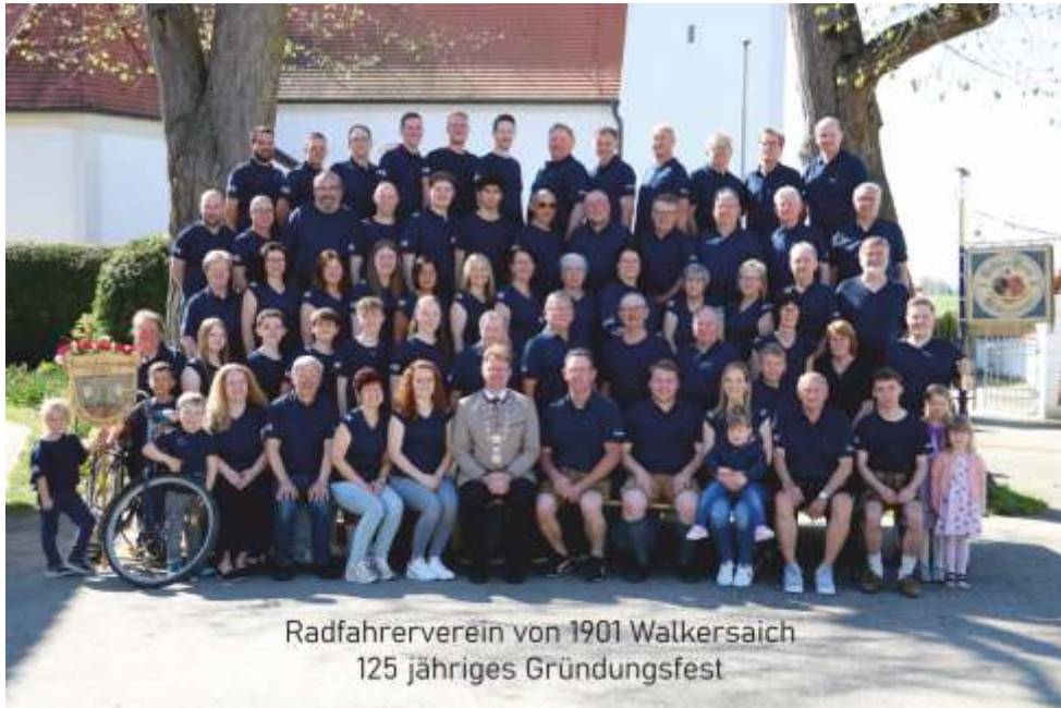
Radfahrerverein von 1901 Walkersaich 125 jähriges Gründungsfest

Der Radfahrerverein von 1901 Walkersaich feiert vom 29.05. bis 31.05.2026 sein 125-jähriges Gründungsfest . Zu diesem besonderen Jubiläum lädt der Verein alle Mitglieder, Freunde sowie befreundete Vereine und die gesamte Bevölkerung herzlich ein, gemeinsam zu feiern und auf eine lange und erfolgreiche Vereinsgeschichte zurückzublicken.